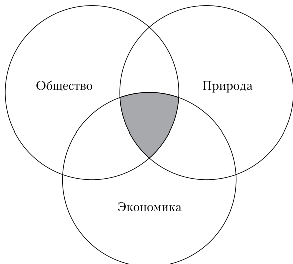
Связь экологических, социальных и экономических факторов

На конференции была подчеркнута роль образования в процессе устойчивого развития, обобщены цели и задачи экологического образования, важнейшей из которых была названа задача – научить людей удовлетворять нынешние потребности и при этом не подвергать угрозе общее будущее. Универсальный характер идей устойчивого развития послужил основой для становления образования в интересах устойчивого развития, которое позволит обеспечить дальнейшее гармоничное развитие общества, экономики и окружающей среды. После изучения теоретических подходов по устойчивому развитию стало очевидно, что проект, задуманный нами, соответствует направлениям деятельности для реализации идей в интересах устойчивого развития.